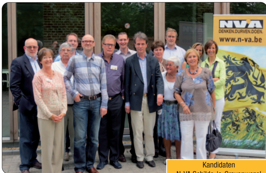
Kandidaten N-VA Schilde-'s-Gravenwezel