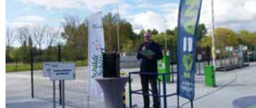
Nieuw recyclagepark: groter én modern! p.3