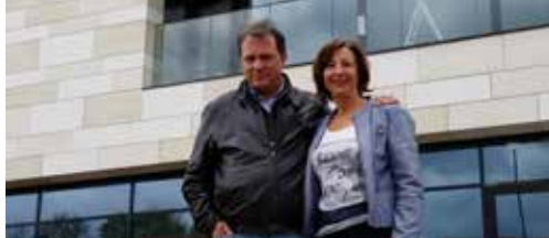
Feestprogramma voor Werf 44 p.2