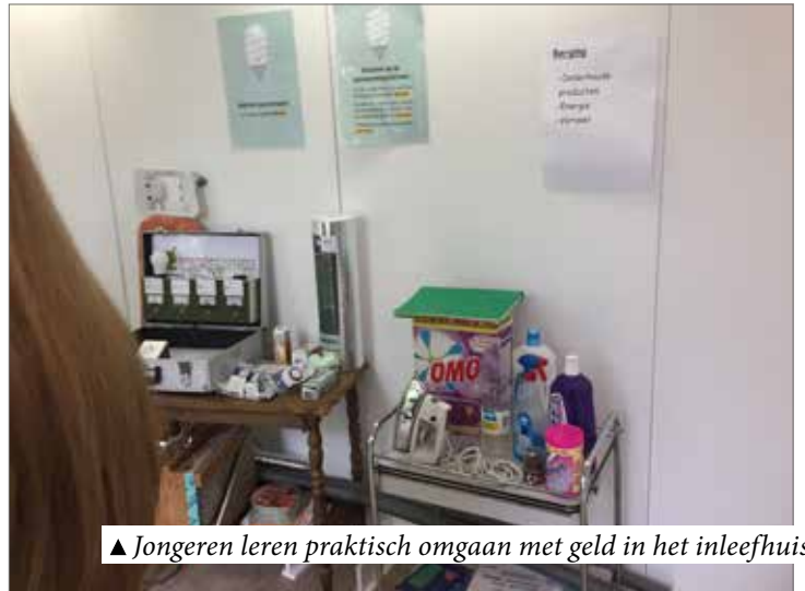
▲ Jongeren leren praktisch omgaan met geld in het inleefhuis.

Daarmee moesten ze onder meer de huur, eten en drinken en elektriciteit ‘betalen’. De deelnemers kregen ook informatie over wat er komt kijken bij het tekenen van een huurcontract en hoe ze kunnen besparen op elektriciteit en water. De reacties waren zeer positief. Een duidelijke meerwaarde, zo klonk het. “Daarom ben ik bereid het initiatief te blijven promoten en ondersteunen”, besluit Frederik Goemaere.