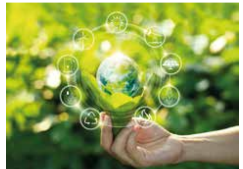
▲ 40 procent minder CO 2 uitstoten tegen 2030: dat is het doel van de gemeente Schilde.

Zo zijn bij het ontwerp van de nieuwe te bouwen voertuigenloods zonnepanelen voorzien via burgercoöperatieven. De loods is ondertussen opgeleverd en in gebruik genomen.